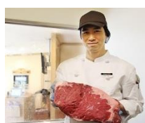
肉は、コックが 1 枚ずつ丁寧に店内でカット