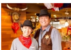
カウボーイ・カウガールが明るくお出迎え

今後も質の高い肉料理や充実したサラダバーを提供し、我が家のホームパーティーにお招きしたようなサービスで、地域の皆様に楽しんでいただけるレストランとなるよう努めてまいります。