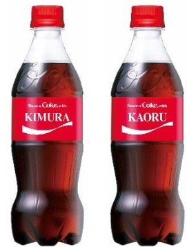
ネームボトルイメージ