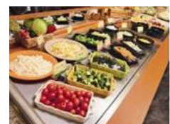
20 種類以上楽しめるサラダバー