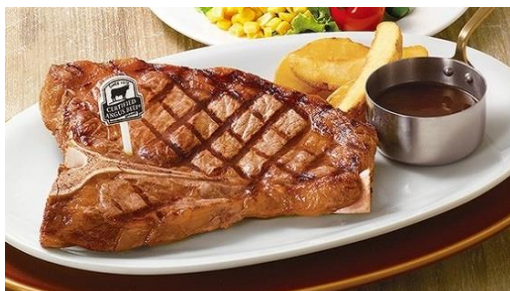
T ボーンステーキ ※画像は 420g

今回登場する「T ボーンステーキ」は、甘味のあるサーロインと赤み肉のヒレが一度に楽しめる、ステーキ好きにはたまらない一品です。また、旨味たっぷりの骨付きサーロイン「L ボーンステーキ」もご用意しました。更に、希少部位である“みすじ”を使用した「みすじステーキ」も販売します。サーロインやヒレとは異なり、あっさりとしながら旨味のある肉質をお楽しみいただけます。さらに、ソーセージとチキングリルも一緒になった「みすじミックスコンボ」、粗挽きハンバーグも味わえる「みすじ&ハンバーグコンボ」も期間限定で登場。「カウボーイ家族」では、米国農務省（USDA）の認定より厳しい基準で選ばれ、アンガス牛の中でも認定が 2 割程の高品質な「サーティファイド・アンガス・ビーフ®（CAB）」を使用しています。ステーキにあわせ、スパークリングワイン、赤・白ワインなどのアルコールも充実させました。